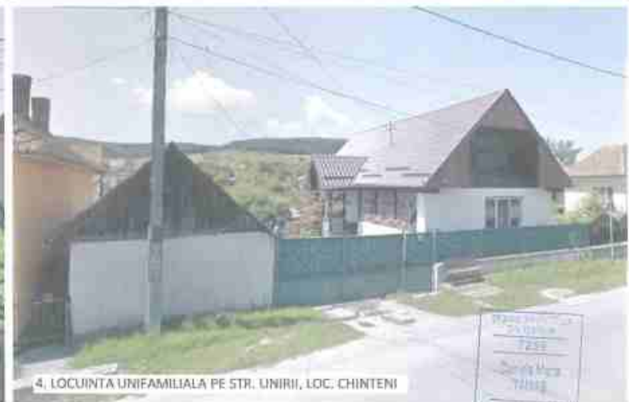
4. LOCUINTA UNIFAMILIALA PE STR. UNIRII, LOC. CHINTENI

În zona Dealurile Ciujului din care face parte și localitatea Chinteni, relieful este tradițional cu pante relativ mari, care favorizează scurgerea apei, respectiv, alinierea zăpezii, geometria lor fiind în patru sau în două ape, în funcție de destinația clădirii și specificul local. În prima jumătate a secolului XX, odată cu înlocuirea învelitorii de paie cu cea de țiglă ceramică trasă, acoperișurile în patru ape sunt înlocuite cu cele în două ape cu fronton triunghiular sau lesit; concomitent, se reduce panta acoperișului până la 45 – 50°.