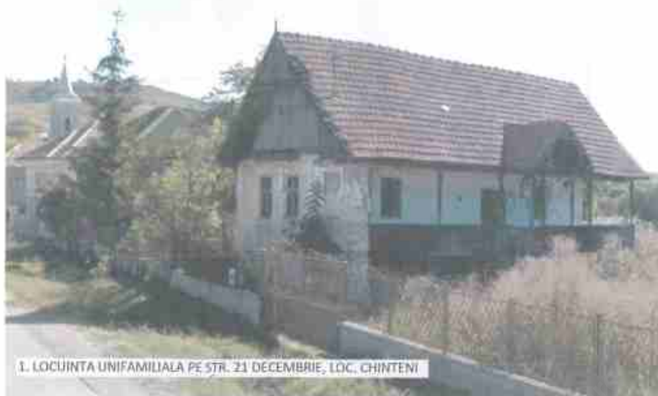
1. LOCUINTA UNIFAMILIALA PE STR. 23 DECEMBRIE, LOC. CHINTENI