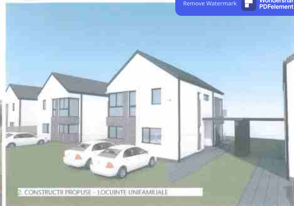
2. CONSTRUCTII PROPUSE - LOCUINTE UNIFAMILIALE