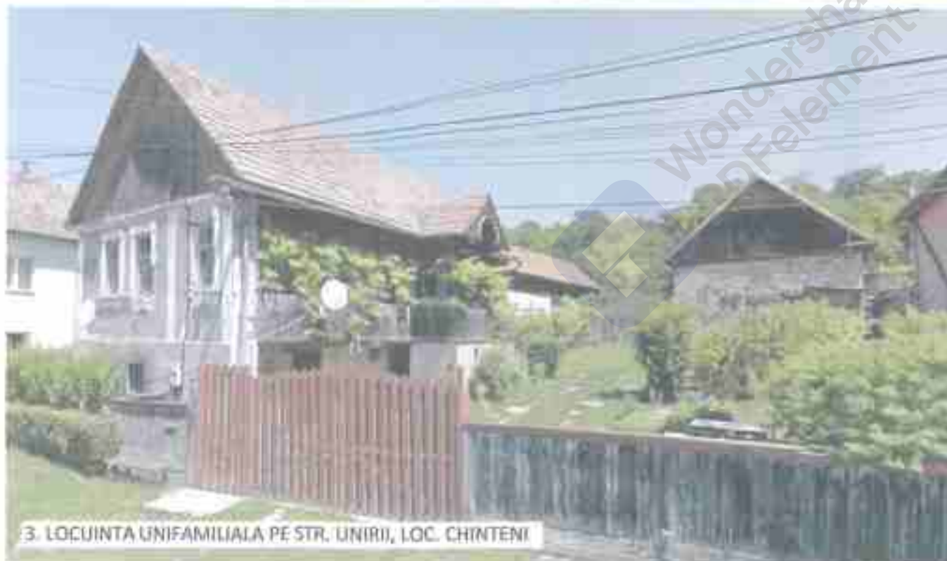
3. LOCUINTA UNIFAMILIALA PE STR. UNIRII, LOC. CHINTENI